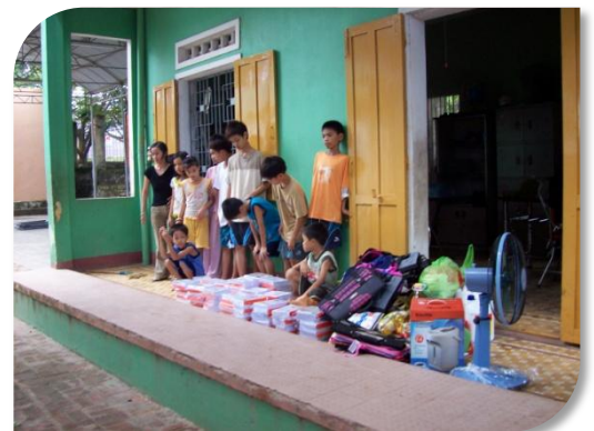
Différents achats lors du passage de membres

Chaque mois, les enfants accompagnés d'un adulte de leur famille sont invités à se rendre soit au bureau administratif à Da Nang, soit dans un local de leur mairie où l'assistante sociale et un employé du Centre leur remettent la mensualité. Les enfants doivent signer un reçu.